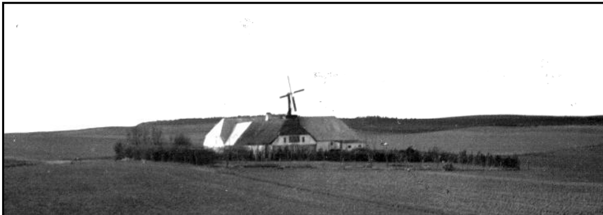
Borbjerggaard - set fra Sorthøj. Bygninger herved - opført 1887