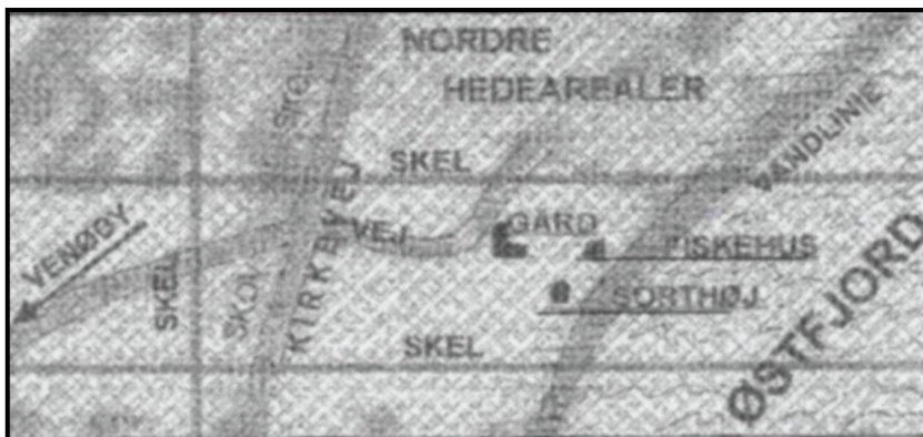
Borbjerggaards jorder - nogenlunde beliggende som det indrammede