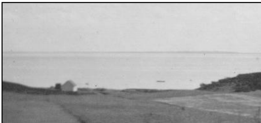
Udsigt over østfjord - mellem fiskerhuse og Sorthøj