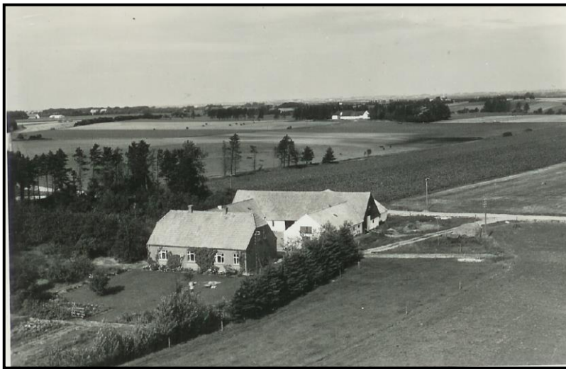
Lille Uhrlund omkring 1952

Ejendomshandel: Den 2. september 1946 var dagen vi flyttede fra "Borbjerggaard" på Venø - til "Lille Uhrlund" i Tvis. For de to ejendomme var der handlet for mageskifte og skæringsdag den 1. september. Men da denne dag var en søndag blev flyttedagen bestemt til om mandagen den 2. september.