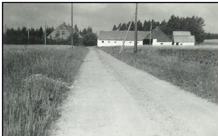
Lille Uhrlund set fra øst med gammel vejføring igennem gård.

Denne jordstykke blev anlagt haven for at undgå en upraktisk jordkile i marken. Så det tjente herved to formål.