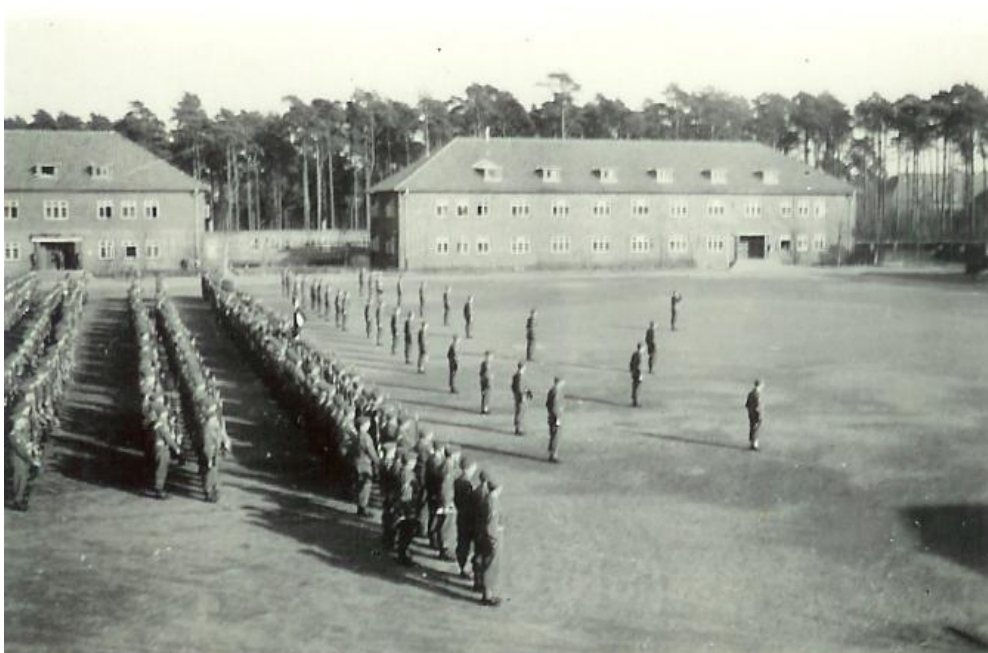
Parade for den engelske general

Dagen efter var der parade for den engelske general som vi var underlagt, han udtalte nogle berigende ord, hvorefter han forsvandt. Derefter orientering om vagttjeneste med 92 mand pr døgn, samt en masse formalier om hverdagen fremover.