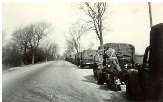
6. oktober 1948 ved hvil før Hamborg

Langt om længe kom vi ud på betonvejen til Bremen, som for det meste kun var farbar i et spor med masser af ødelagte broer.