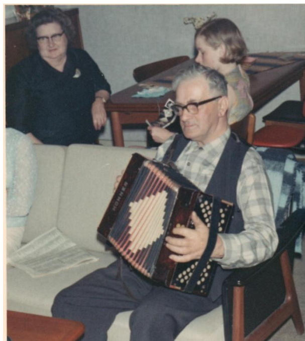
Marinus mester harmonikaen ved forskellige lejligheder