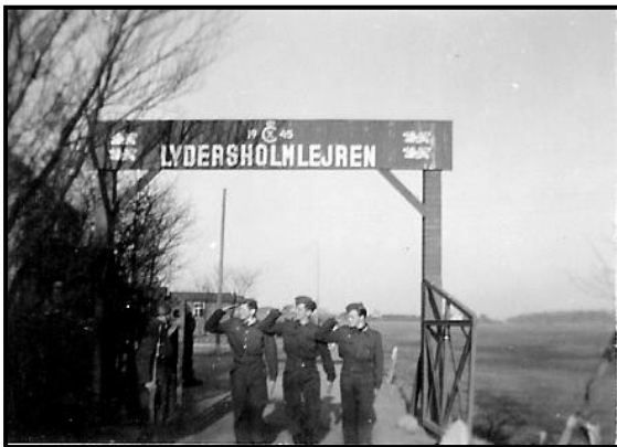
Indgangsvagt ved Lydersholmlejren