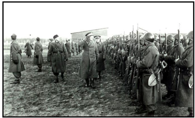
Parade i anledning af Kong Christian den X død