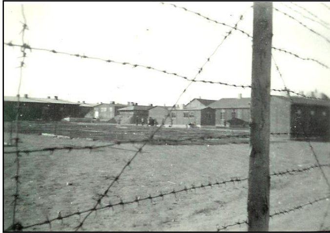
"Skovbylejren" – bag pigtrådsafspærring