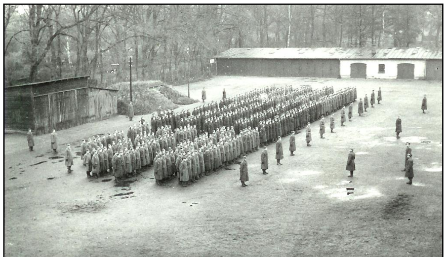
Parade ved 5. Bataljon – Odense Kaserne