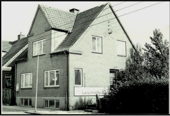
Danmarksgade 45 – Aulum. Mælkeudsalg i kælder.