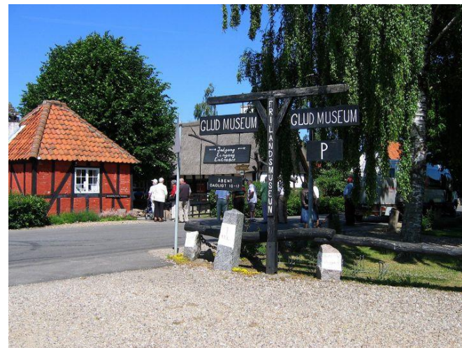
Glud museum 2010