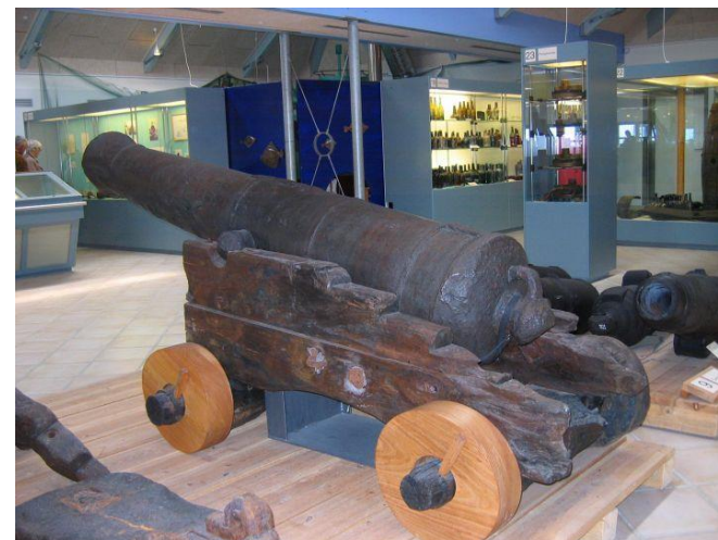
Strandingsmuseet Thorsminde 2009

Øvrige referater og foto åbnes fra hjemmesidens billedegallerier